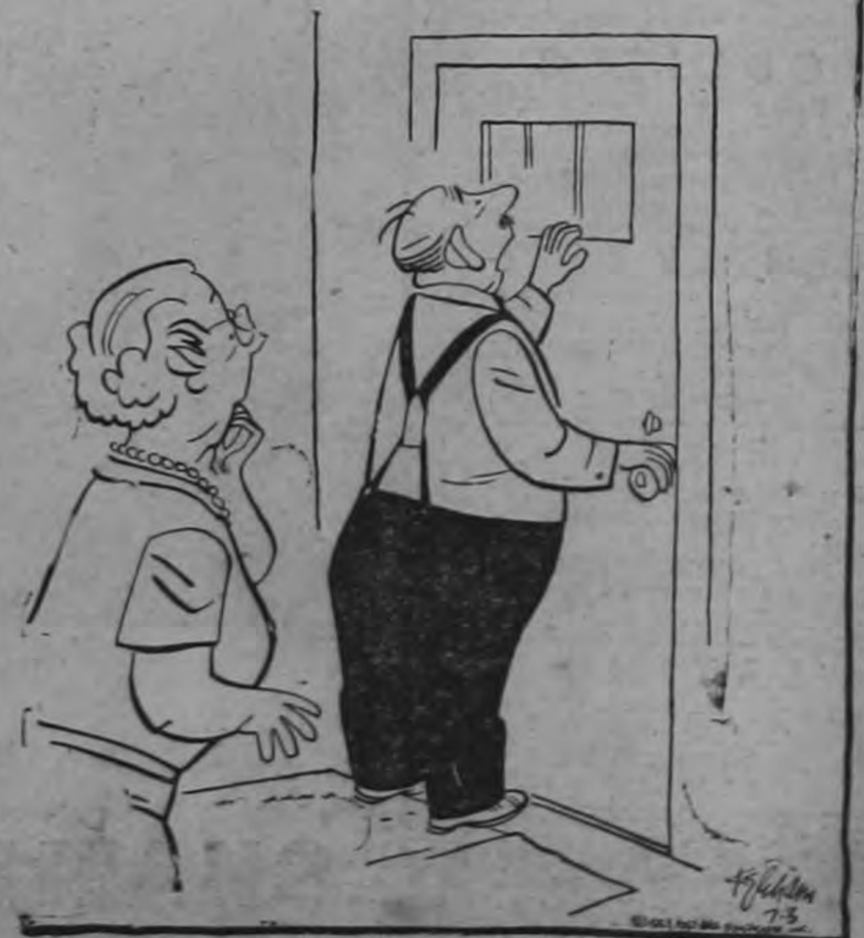
— Son ellos! ¡Y lo traen a él!