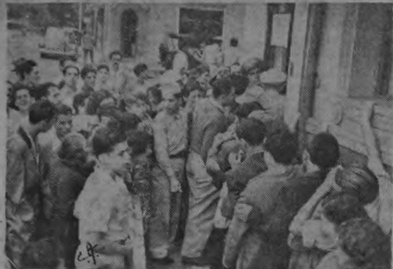
Empujones, pleitos, para lograr un buen puesto en la fila ante las puertas del Servicio Nacional de Electricidad. Escena repetida a lo largo de más de 24 horas seguidas, clara muestra de la urgencia de un mayor desarrollo hidroeléctrico.

La gravedad del problema que significa la escasez de energía eléctrica, ha tenido dramática exteriorización en nuestra ciudad. Desde las seis de la tarde del lunes, ante la puerta del Servicio Nacional de Electricidad se había reunido una gran cantidad de personas, que se organizaron en fila desde esa hora para inscribirse en el registro de solicitantes que iba a abrirse al día siguiente, a las siete de la mañana.