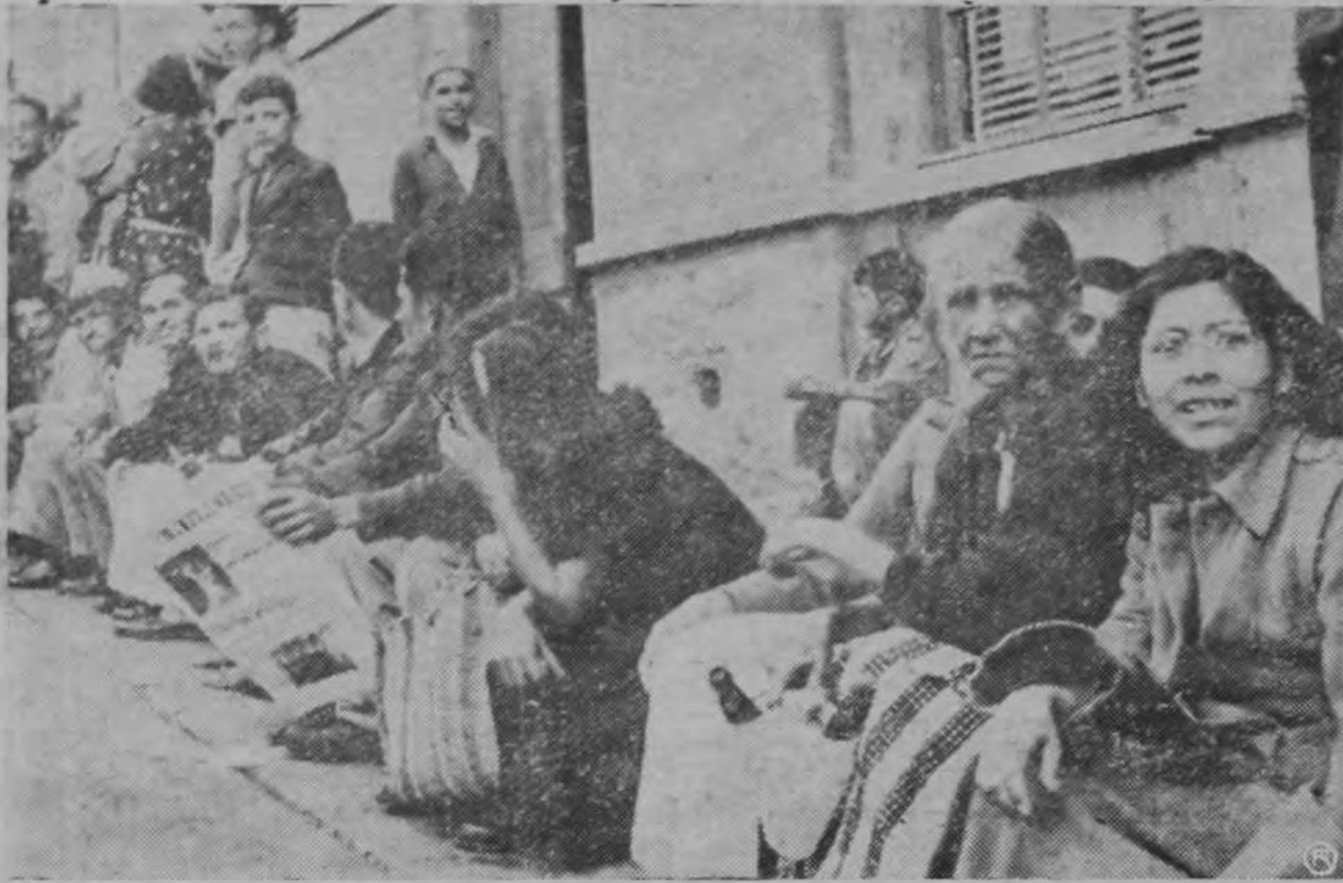
En paciente espera pasaron toda la noche y el día, y muchos volverán hoy para tratar de conseguir el ansiado medidor. El Servicio Nacional de Electricidad calcula que los casos urgentes son unos tres mil quinientos. ¡Menudo problema le toca resolver!