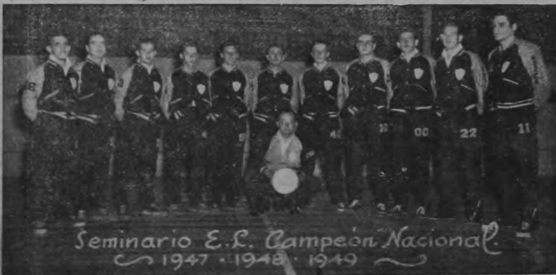
El maravilloso conjunto del "Seminario E. L." que anoche derrotó sensacionalmente al equipo mexicano de basquetbol "Poza Rica" por score de 60 contra 58.— Con este triunfo Costa Rica ganó la serie.—